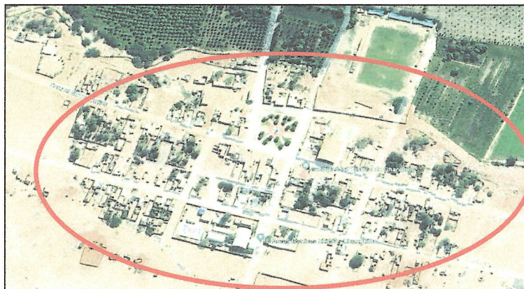
Imagen N° 1: Ubicación del Proyecto con CUI N° 2458102.