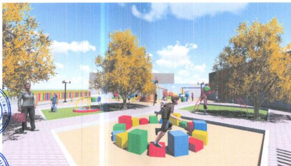
Imagen N° 04: Vista General del Mobiliario y equipamiento planteado