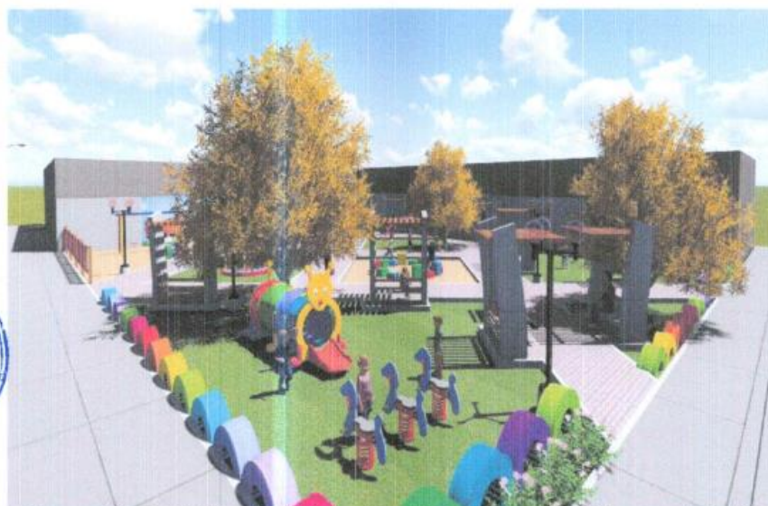
Imagen N° 02: Distribución tridimensional del mejoramiento del parque infantil.