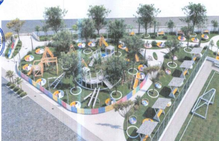
Imagen N° 01: Distribución planteada en el Expediente Técnico

Términos de Referencia de la Contratación de la Ejecución de la obra: “CREACION DEL SERVICIOS DE ESPACIOS PÚBLICOS URBANOS EN EL PARQUE INFANTIL DE CENTRO POBLADO CRISTINO GARCIA CARHUAPOMA DISTRITO DE SAN RAFAEL DE LA PROVINCIA DE BELLAVISTA DEL DEPARTAMENTO DE SAN MARTIN CUI: 2653962”