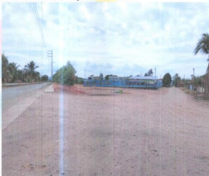
Fotografía N° 01: Espacio actual del parque de recreación infantil

La Municipalidad Provincial de Bellavista , intenta incorporar una nueva forma de producir desarrollo urbano en el espacio público para consolidar como centro poblado, cabe indicar que sus acciones están orientadas a mejorar las áreas recreativas de las localidades del ámbito de su jurisdicción, para mejorar la calidad de vida de la población; fortalecer el tejido social y la organización local, y mejorar la calidad ambiental del entorno y elevar la calidad de vida de la población existente de la provincia de Bellavista y sus centros poblados.