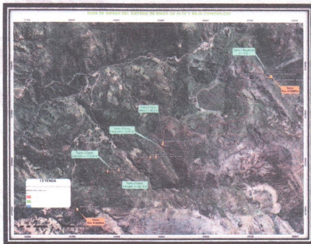
Imagen satelital de la ubicación del sistema de Riego CD Alto y Bajo Chinchilcay.