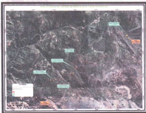
Imagen satelital de la ubicación del sistema de Riego CD Alto y Bajo Chinchilcay.