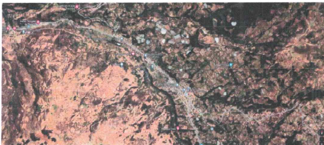
Centro Poblado de VICOS: I.E. 235, nivel Inicial