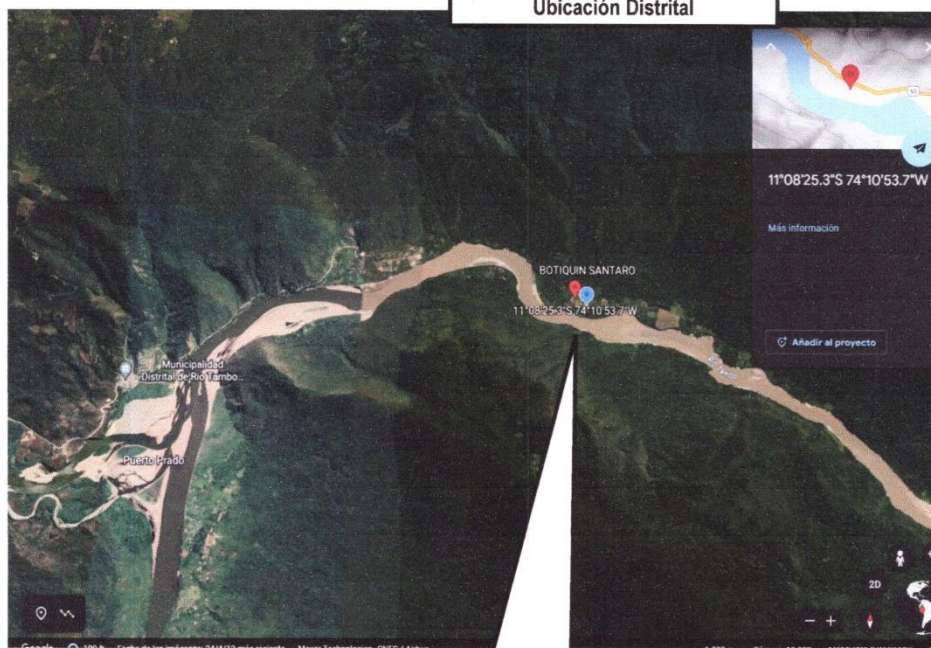
Ubicación Distrital-Valle de Río Tambo-CN Santaro