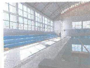
Imagen 11: Pintura desgastada en graderías de piscina de adultos y niños.