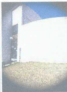
Imagen 06: Tratamiento anti salitre en muros exteriores, posteriores.