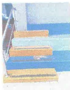
Imagen 04: Pintura en graderías descascarada.