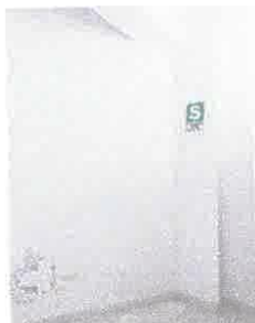
Imagen 05: Suciedad en muros interiores.