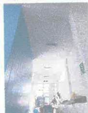
Imagen 09: Suciedad en muros pasadizo a zona personal.