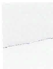
Imagen 08: Grietas en ángulos entre muro y losa, se deberá reparar.