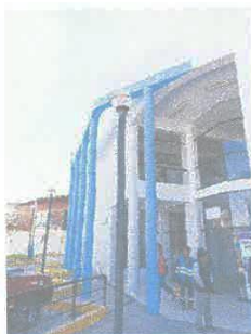
Imagen 05: Suciedad y manchas en muros exteriores, frentera.