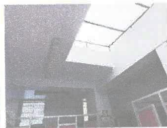
Imagen 03: Cielo raso en ss.hh. se visualiza descascaramiento de pintura.