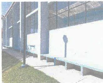
Imagen 02: Se visualiza zonas salitrosas, se deberá realizar tratamiento anti salitre.