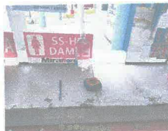
Imagen 14: Mesa de poliéster, pintura desgastada y sucia.