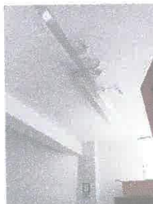
Imagen 06: descascaramiento de pintura en cielos rasos.