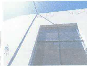
Imagen 10: Descascaramiento de pintura en muros exteriores superiores.