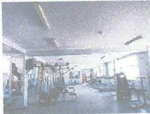
Imagen 10: Suciedad en muros y cielo raso de gimnasio.