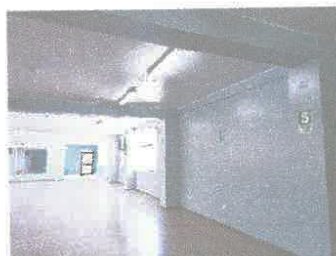
Imagen 12: Descascaramiento de pintura en cielo raso de salón de baile.