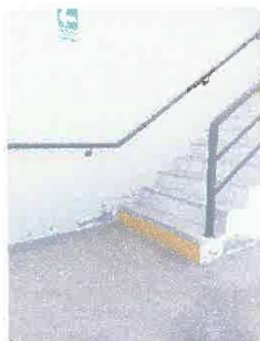
Imagen 04: Tratamiento anti salitre en graderías de emergencia.