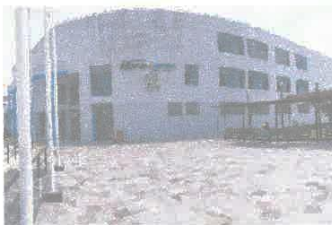
Imagen 09: Vista frontal del complejo, pintura deteriorada.