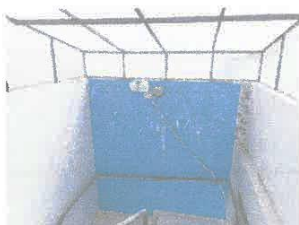
Imagen 08: Suciedad en muros de graderías de emergencia.