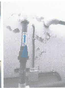
Imagen 07: Tratamiento anti salitre en muros de sala de máquinas.