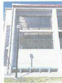
Imagen 03: tratamiento anti salitre en muros exteriores.