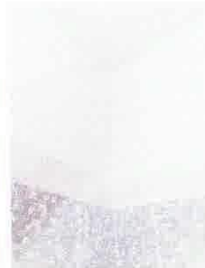
Imagen 07: Grietas en ángulos entre muro y losa, se deberá reparar.