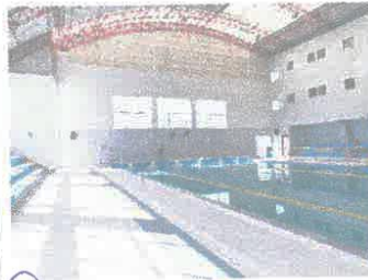
Imagen 13: Suciedad en muros internos de piscina, se verifica zonas salitrosas.