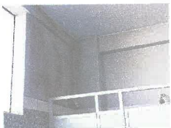
Imagen 01: Hongos en paredes interiores de los ss.hh. de la piscina, debido a la humedad.