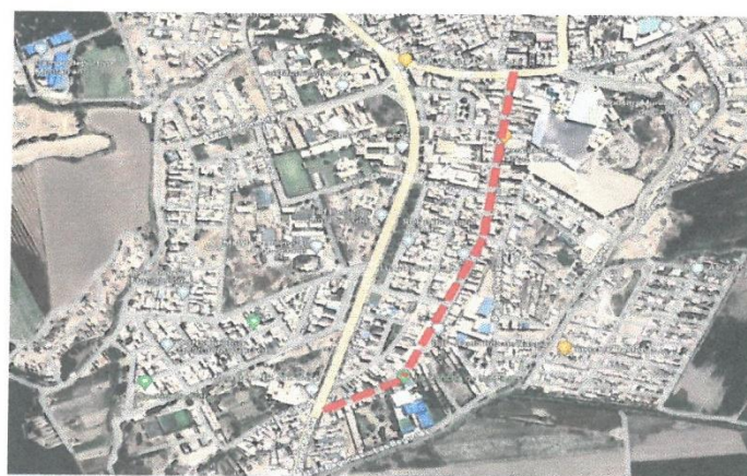
INTERVENCIÓN EN LA AV. 28 DE JULIO