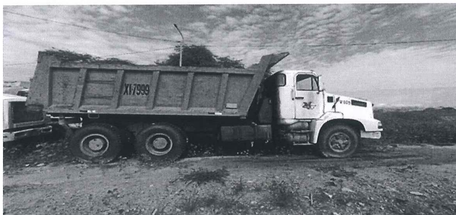
IMAGEN 08: Corona Presenta Fuga de Lubricante