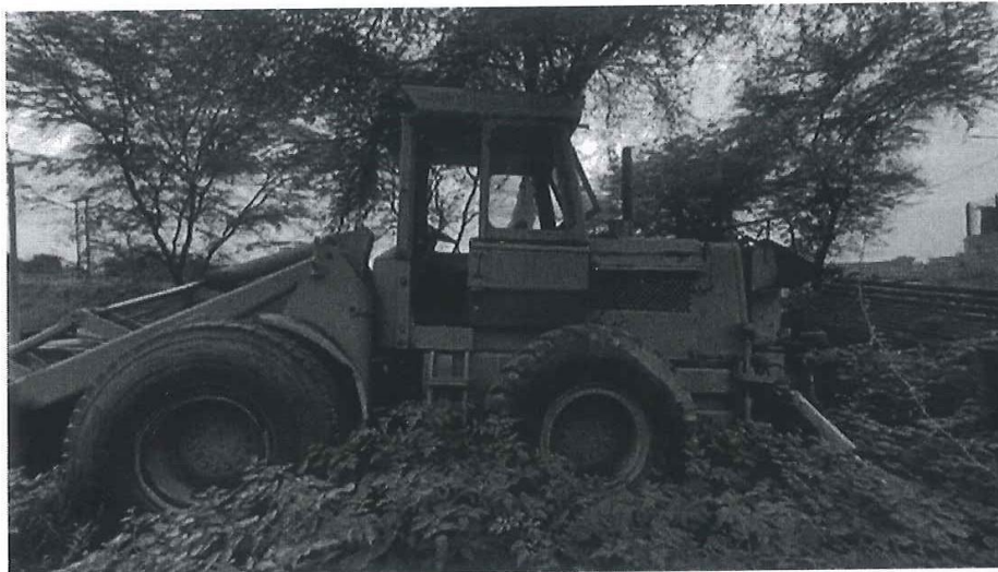
IMAGEN 05: Sistema hidráulico requiere reparación general