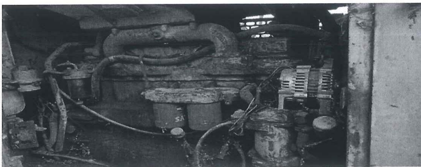
IMAGEN 07: Camión Volquete Volvo EGR-342, código patrimonial 678299500013.