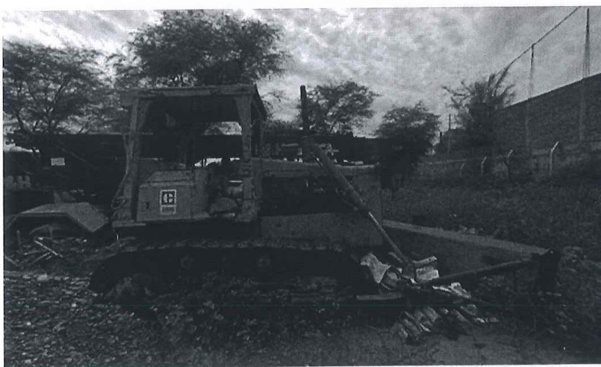
IMAGEN 01: Tractor Oruga Caterpillar, código patrimonial 673692590002.

El Proyecto Especial Chira Piura tiene como misión: Promover, desarrollar, administrar, operar y mantener la infraestructura hidráulica en las cuencas Chira y Piura que abastecen el agua para uso poblacional y productivo, del tipo agrario, acuícola, energético, industrial, minero, recreativo y turístico. Promover y propiciar el uso racional, eficiente y sostenible del agua produciendo, comprobando y transfiriendo conocimiento y tecnología para optimizar su aprovechamiento. Promover la inversión privada para el desarrollo y la administración de nueva infraestructura hidráulica y fortalecer a las organizaciones de usuarios para la gestión de los recursos hídricos, la operación y el mantenimiento de la infraestructura hidráulica a su cargo . Esta misión se ve afectada por no contar con la maquinaria y equipos que permitan el buen desarrollo de las actividades de mantenimiento, descolmatación, y limpieza de drenes, canales y caminos de servicio. Puesto que como institución encargada de esta importante misión solo cuenta con maquinaria obsoleta cuya vida útil ya se cumplió, el siguiente panel fotográfico evidencia lo mencionado: