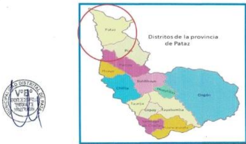
IMAGEN N° 02: DISTRITO DE PATAZ EN LA PROVINCIA DE PATAZ