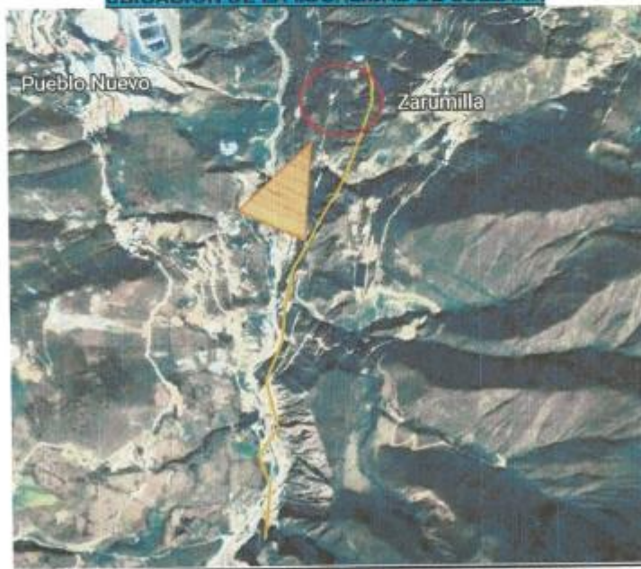
IMAGEN N° 03: UBICACIÓN DE LA CAPTACION A LA SULLANA