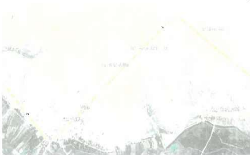
Vista de la Ciudad de Vice

El distrito de Vice, limita por el Norte con El Tablazo y El distrito de la Unión hasta la zona de Punta Perico del distrito de Paita. Por el Sur con Sechura, Rinconada y el Océano Pacífico. Por el Este con La Unión y Rinconada. Por el Oeste con el Océano Pacífico.