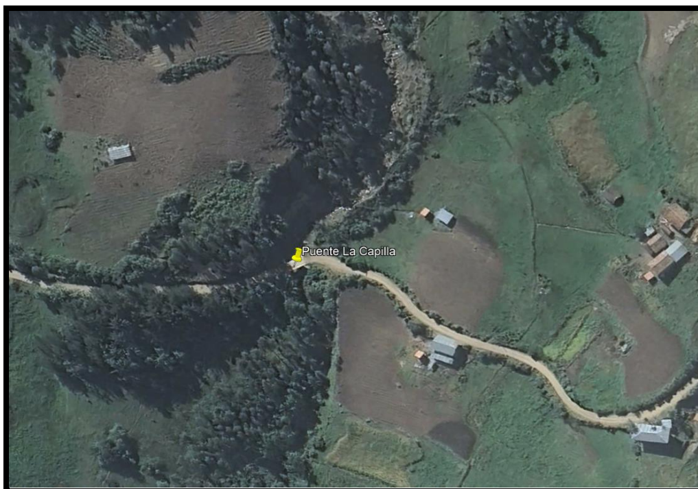
Figura 2: PUNTO DE UBICACIÓN DEL PROYECTO

El puente EL (LA) CAPILLA es de tipo VIGA-LOSA, conformado la por 2 vigas principales de 40x80cm, con diafragmas de 30x60cm, losa con refuerzo de acero de 25 cm y vereda de 1.20m libre. Además, cuenta con barandas metálicas h=1.10m, juntas de dilataciones, losa de aproximación y señalización para una mejora transitable fluida en el lugar de estudio METAS FÍSICAS