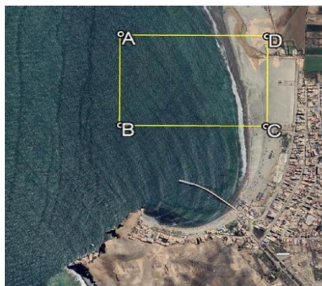
Figura 1. Área de levantamiento geofísico con Sub bottom profiler o tomografía eléctrica ó Ensayo SCPTU

Se debe realizar una campaña de investigación geofísica considerando la prospección geofísica usando la técnica con sub-bottom profiler o tomografía eléctrica ó ensayo SCPTU. Esta exploración deberá permitir conocer la morfología del fondo marino y el perfil estratigráfico de la zona donde se colocarán los pilotes de concreto o metálicos; consideradas en el proyecto. Asimismo, esta se calibrará en función de las muestras profundas obtenidas mediante Wash Boring y mediante la toma de muestras superficiales.