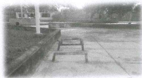
Instalación de bancas de madera