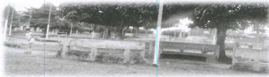
PINTADO DE LA PLAZA DE ARMAS