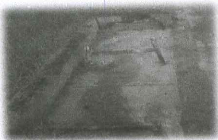
Refacción de sardinell, muro y bancas