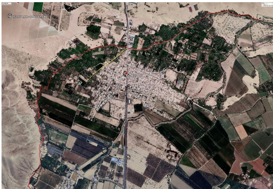
Gráfico 1 Recorrido del cauce - Fuente: Elaboración propia

El área de Influencia destinada para la Ejecución del Proyecto de Inversión Pública: "LIMPIEZA - DESCOLMATACION DE LOS CANALES LA MAURICIO TRAMO 1, TRAMO 2 Y RAMAL LATERAL LOVERA DISTRITO SALAS PROVINCIA ICA DEPART. ICA" , involucra directamente a toda la población del Centro Poblado Guadalupe.