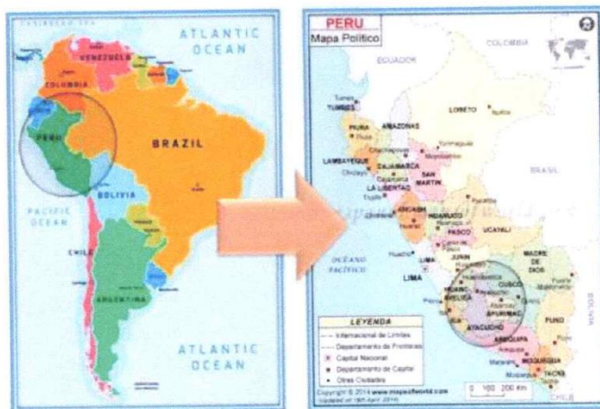
FIGURA Nº 01 - MAPA DE UBICACIÓN MACRO