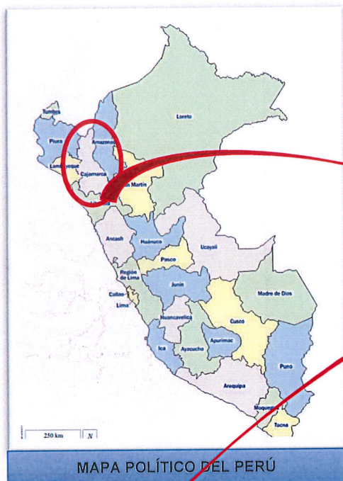
Imagen N° 1: Mapas de Ubicación del Distrito.

ANDINO, SANTA MARTHA, COMUCHE, CHORRO BLANCO, AGOMAYO, LA CASCARILLA.