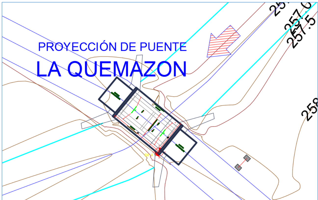
Imagen N°1: Vista en Planta de Puente (Fuente: Expediente técnico, Planos).