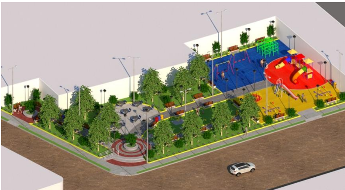
Figura N° 7: Vista General del Parque Infantil

El proyecto contempla la construcción de áreas de juegos infantiles con piso de gras sintético de colores, en donde se instalara 01 columpio, 01 sube y baja, 01 tobogán, 01 cubo y 01 castillo, así mismo, un área de juegos lúdicos, una zona de juegos con resortes infantiles, y un gimnasio al aire libre; en el recorrido del parque se contará con 02 jardineras centrales de concreto ubicadas en las entradas del proyecto, con pisos de adoquín, bancas de madera y fierro fundido, luminarias ornamentales y basureros; y por último se instalará Grass natural y diferentes tipos de arborización.