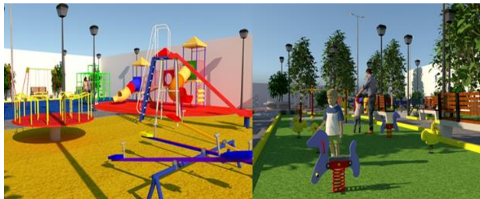
Figura N° 8: Vista de la Zona de Juegos Infantiles