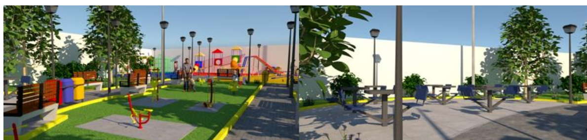
Figura N° 9: Vista de las zonas de juegos lúdicos y zona de gym