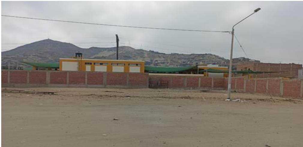
Figura N° 5: Vista de terreno con las calles principales

El terreno del Proyecto se encuentra ubicado en el distrito de Chao, en el sector Nuevo Chao II, esta área está destinada para USO de un PARQUE; actualmente el terreno se encuentra deshabitado y la población lo utiliza como botadero.