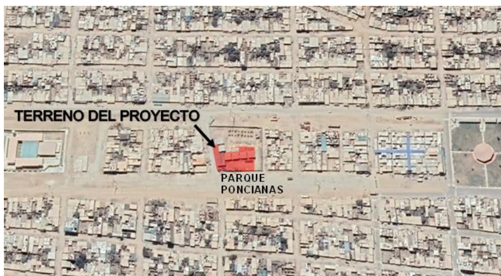
Figura N° 3: Esquema de Ubicación General