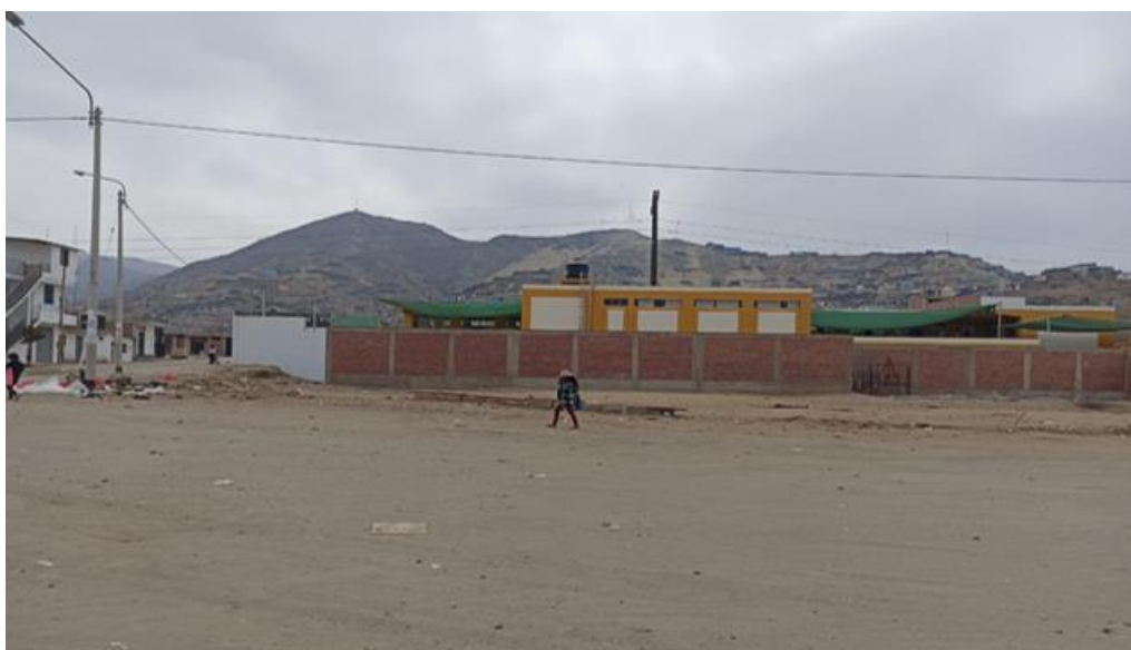
Figura N° 6: Vista de terreno deshabitado