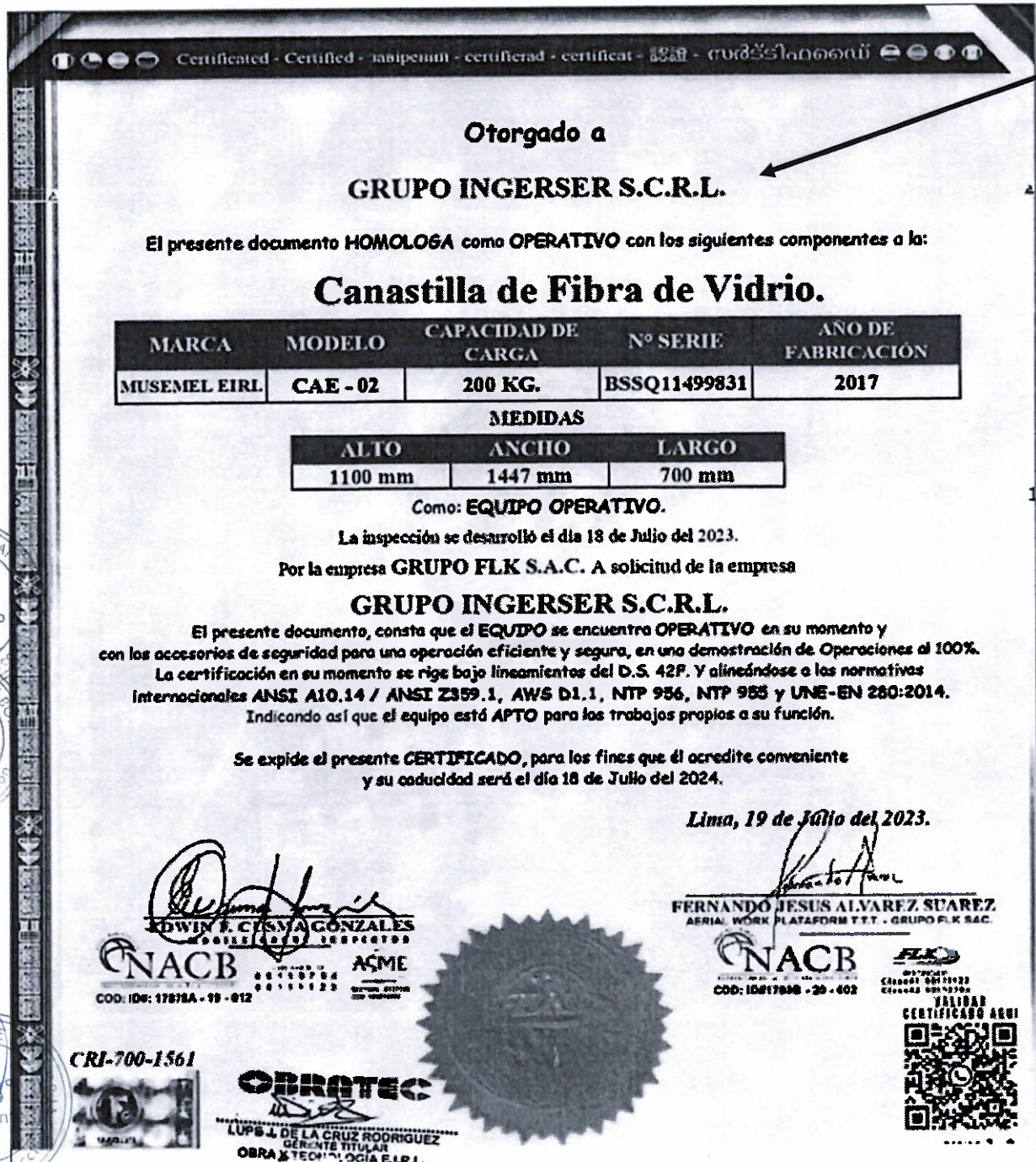
(Imagen N° 01)

(i) LA CANASTILLA COMO PARTE DEL EQUIPAMIENTO ESTRATEGICO PRESENTADA POR EL POSTOR OBRATEC E.I.R.L. (PAGINA 16 DE SU OFERTA) HACE REFERENCIA A NOMBRE DE OTRA EMPRESA (Imagen N° 01), Y SEGÚN LO ESTABLECIDO EN LAS BASES INTEGRADAS, PARA ACREDITAR EL EQUIPAMIENTO ESTRATEGICO SE DEBE PRESENTAR COPIA DE DOCUMENTOS QUE SUSTENTEN LA PROPIEDAD, LA POSESIÓN, EL COMPROMISO DE COMPRA VENTA O ALQUILER U OTRO DOCUMENTO QUE ACREDITE LA DISPONIBILIDAD DEL EQUIPAMIENTO ESTRATÉGICO REQUERIDO, POR LO CUAL NO CALIFICA.