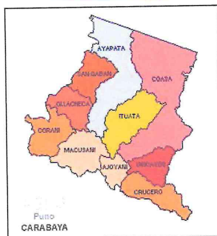
Provincia de Carabaya