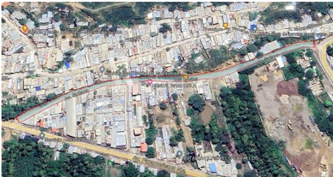
Fotografía 01: ubicación de proyecto general.

Las áreas verdes proyectadas a lo largo de la avenida se encuentran llenos de basura producto que actualmente se encuentra y terreno natural sin plántones ni áreas verdes.