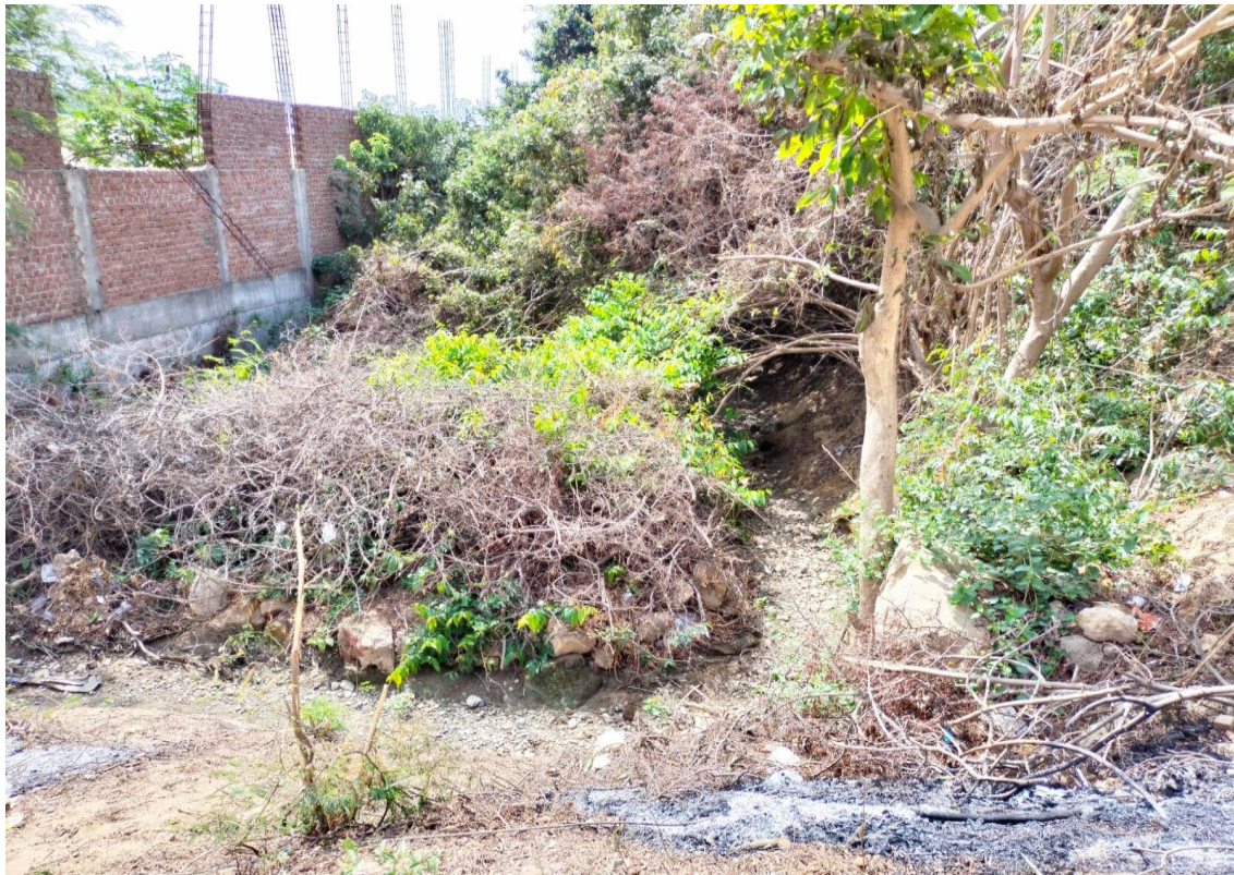
Fotografía 09: final de tramo de canal.