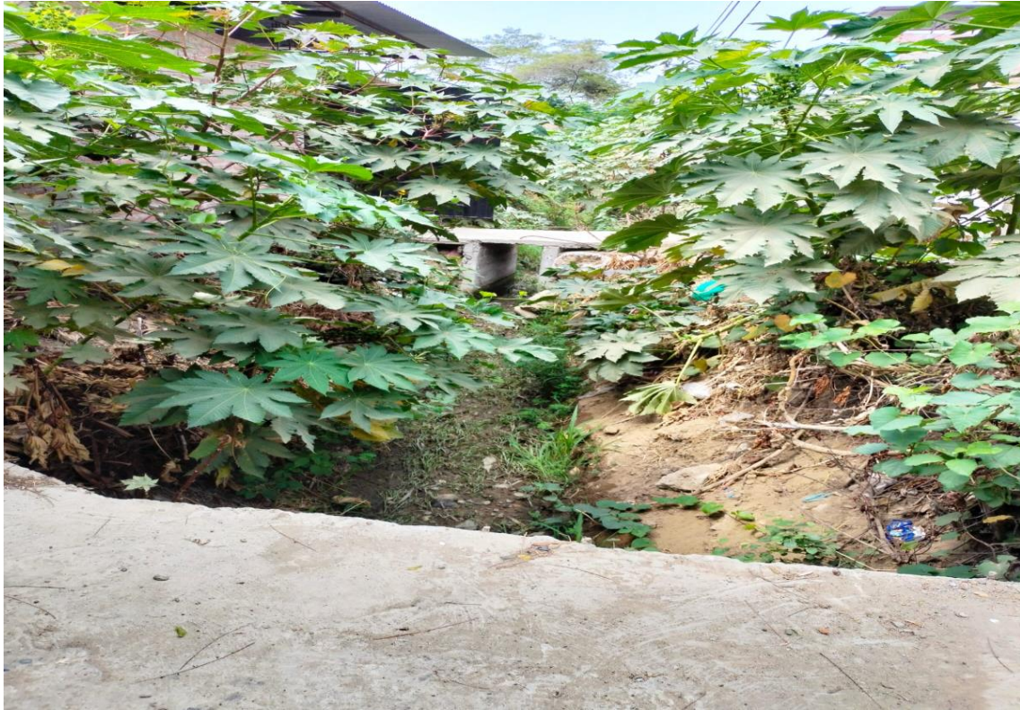
Fotografía 05: estructuras existentes en canal.