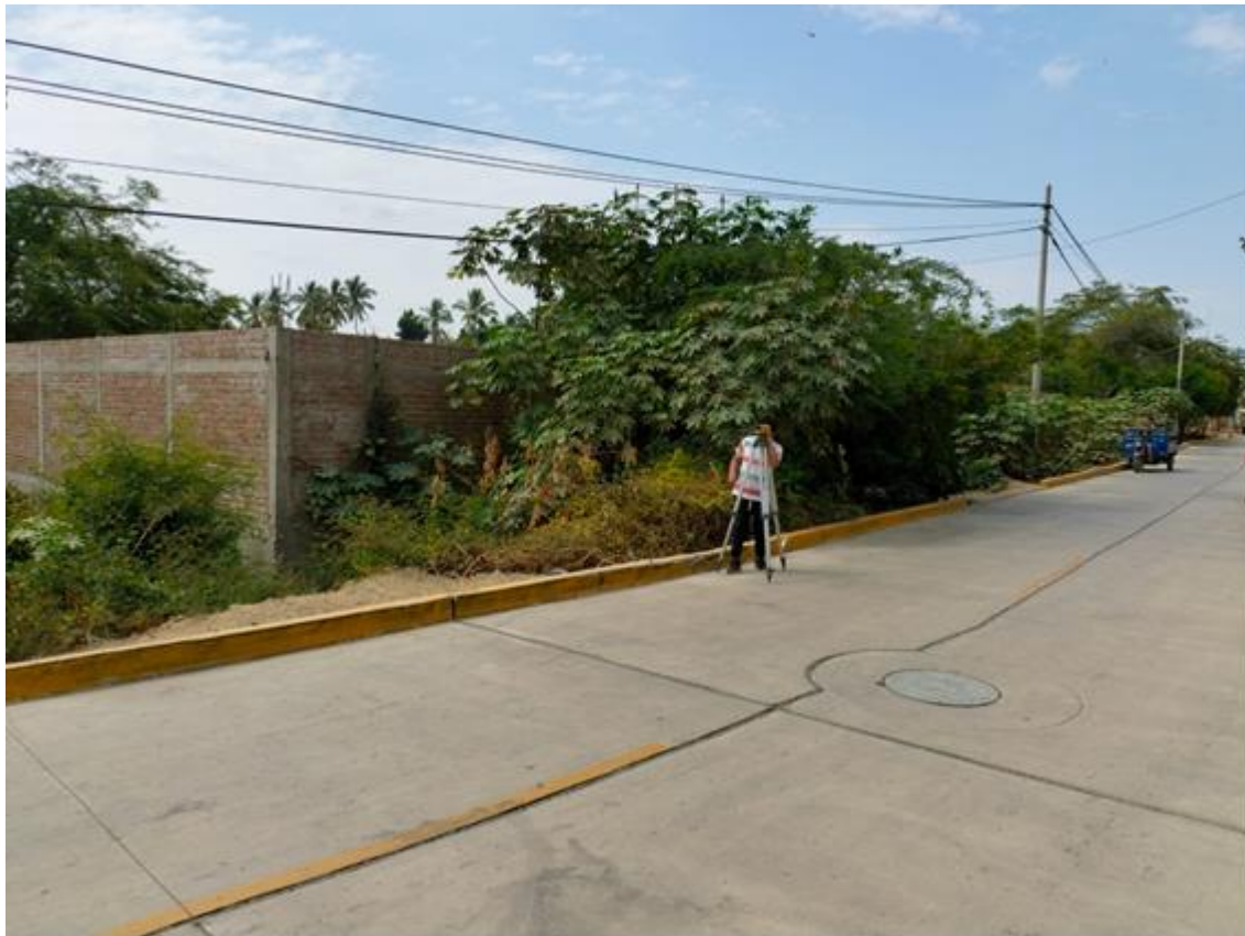
Fotografía 03: colmatacion de canal existente.