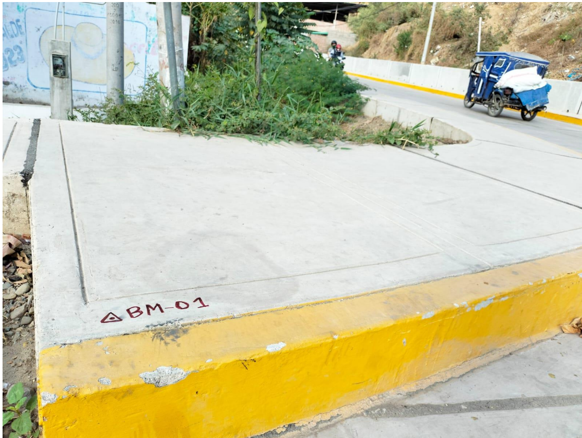
Fotografía 11: MB-01.