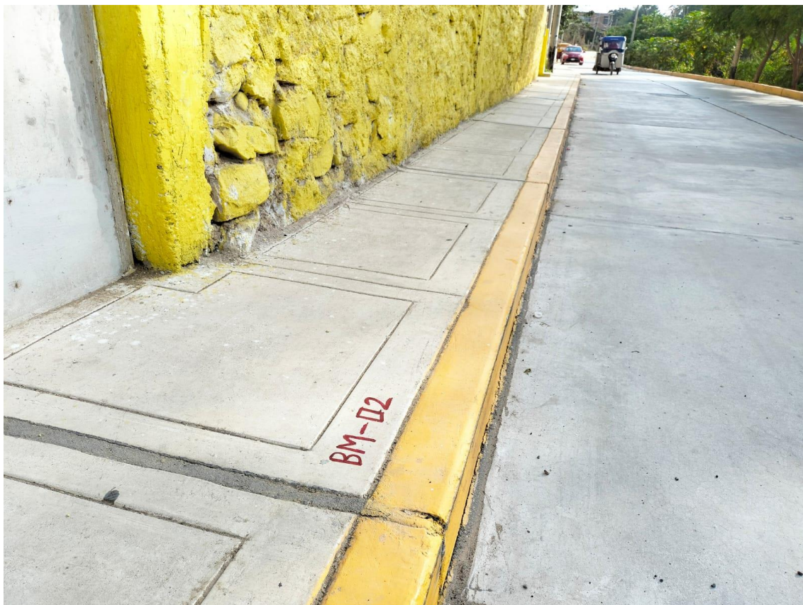
Fotografía 12: BM-02.