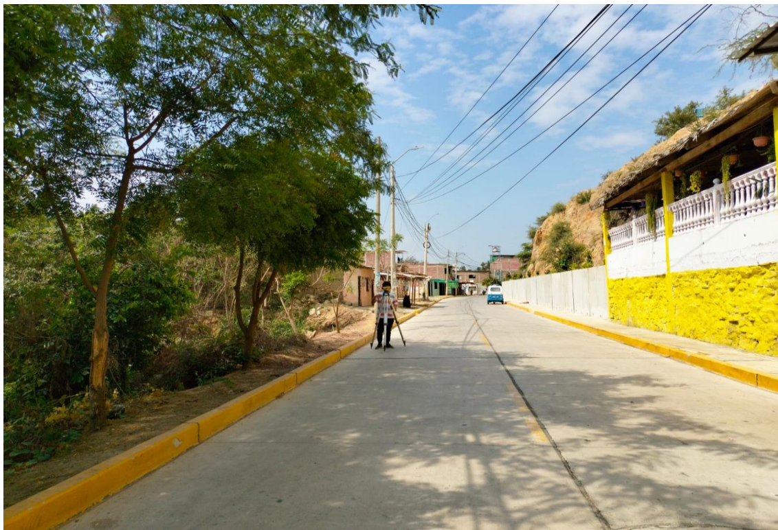
Fotografía 07: verificación de BMS.