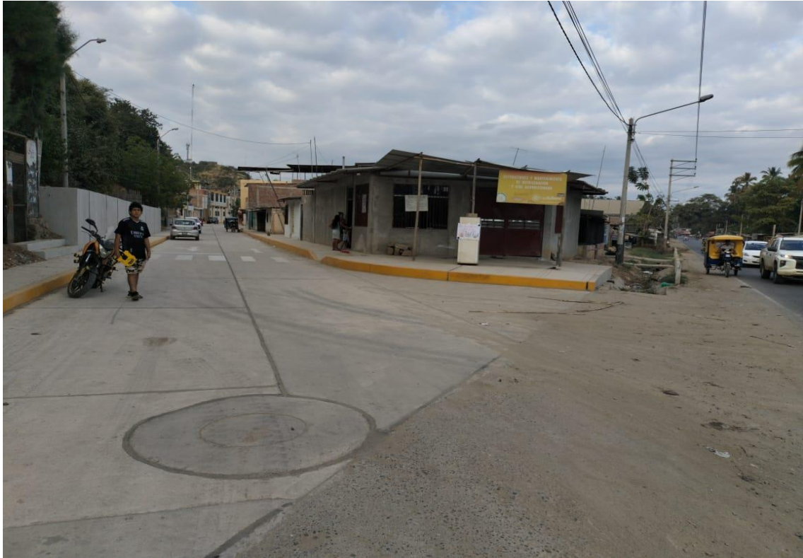
Fotografía 15: ingreso n° 02 .