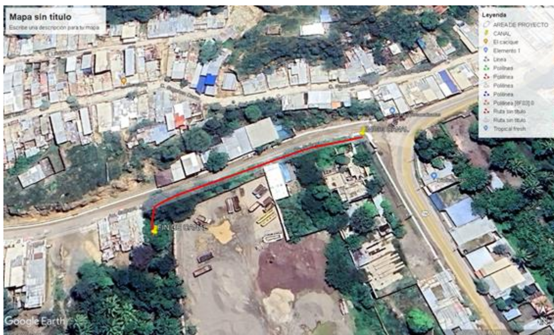
Fotografía 02: ubicación de ingreso principal 01 y canal.