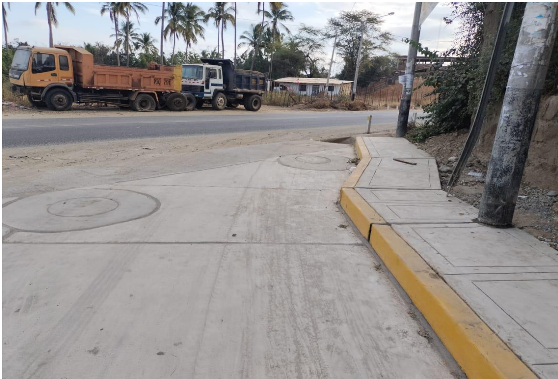
Fotografía 16: ingreso n° 02 .