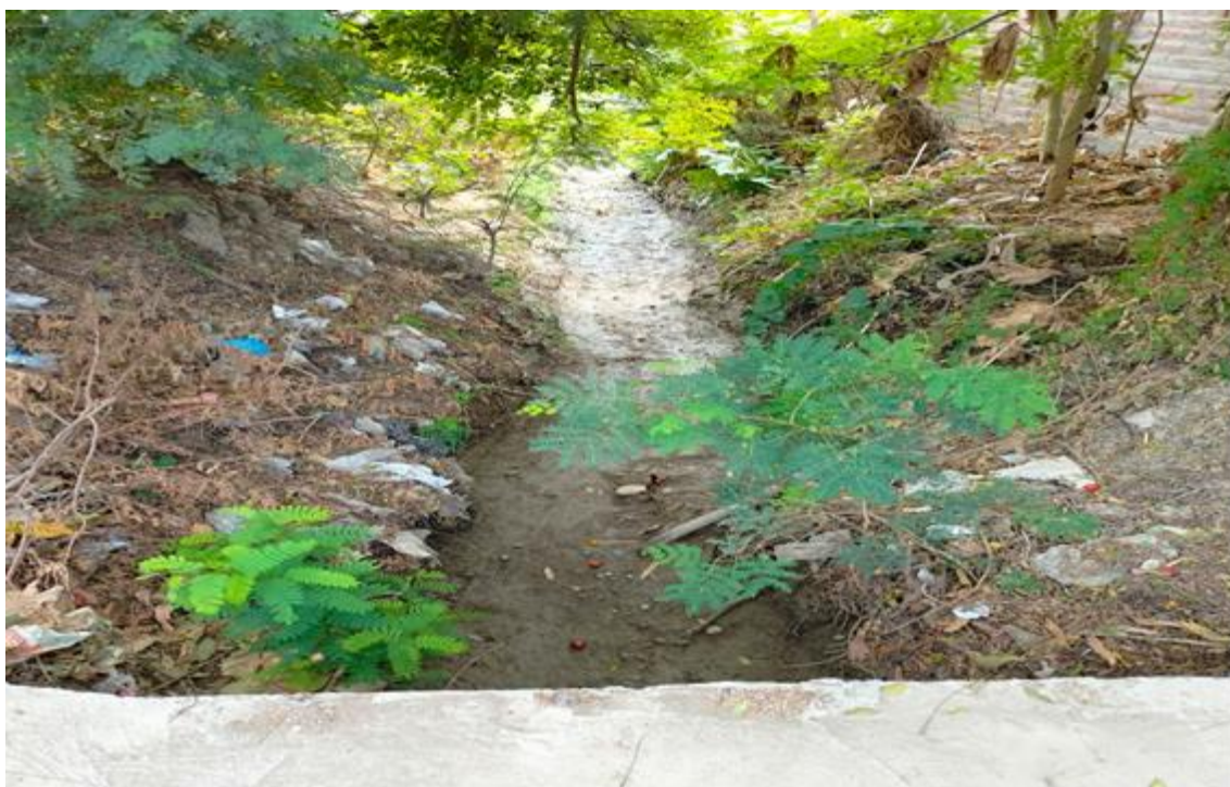
Fotografía 04: cause de canal existente.