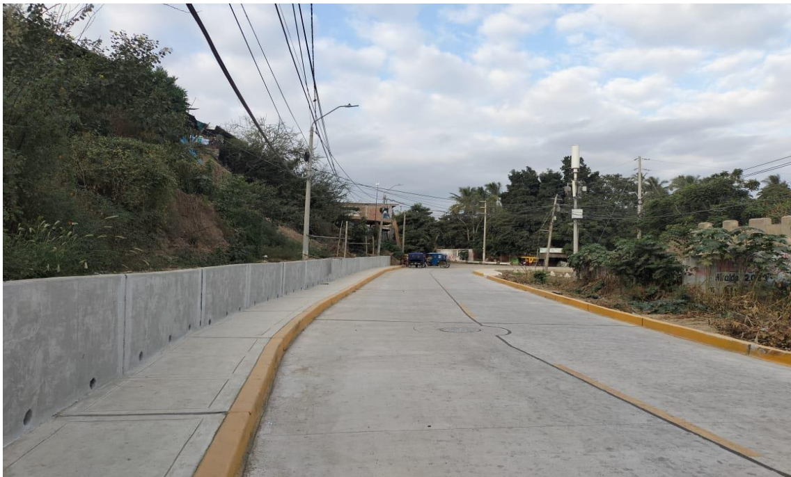
Fotografía 14: ingreso n° 01 .