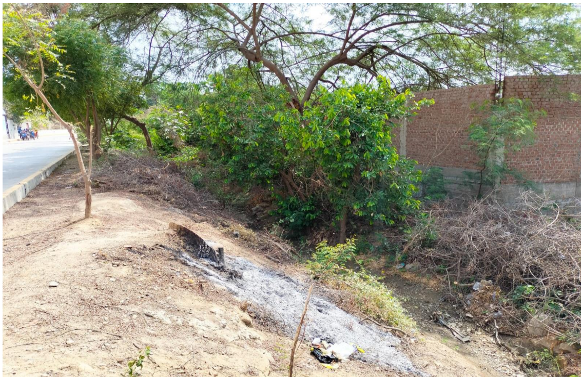
Fotografía 10: se muestra espacio entre canal y estructura existente.