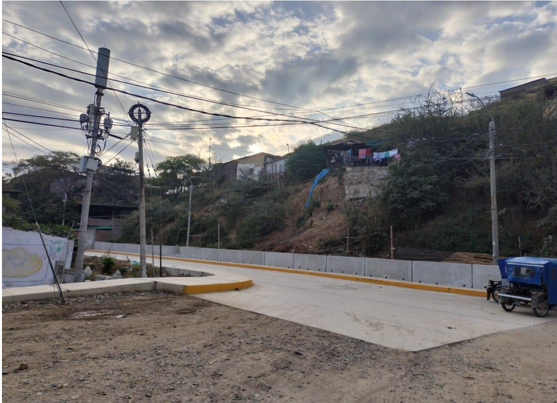
Fotografía 13: ingreso n° 01 .