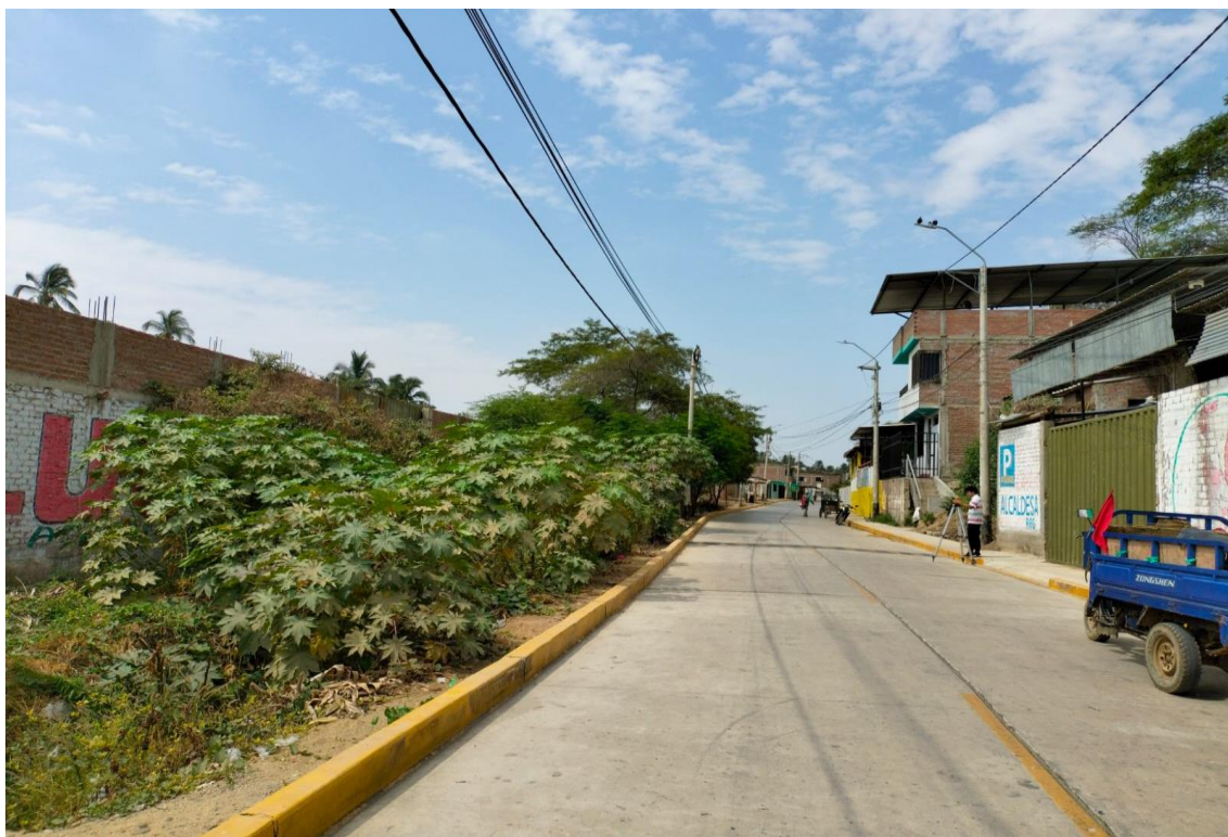
Fotografía 08: colmatación de canal.