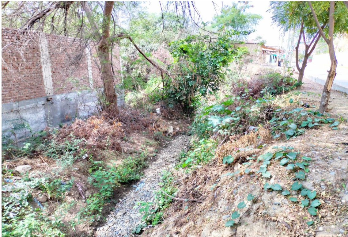
Fotografía 06: final de canal proyectado en el trayecto.