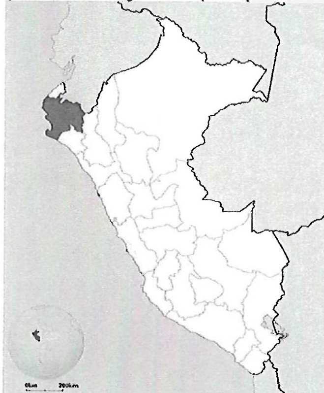
Esquema de Ubicación Geográfica en el Mapa de la Provincia de Piura