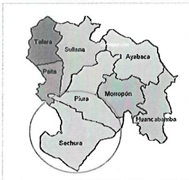
Plano de Localización y Ubicación