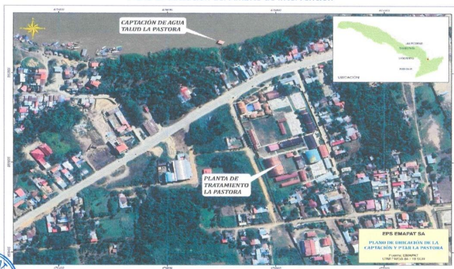
Plano 1: Ubicación del Ámbito de Intervención