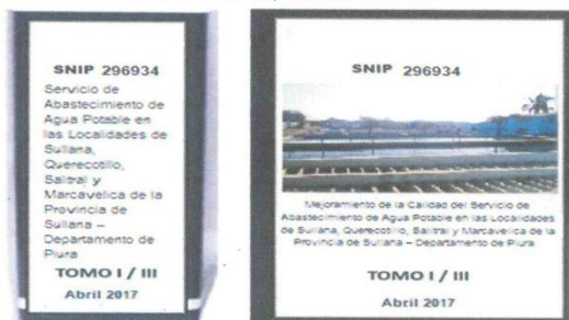
Ilustración 1: Modelo de Presentación del Expediente Técnico

A continuación, se describen los plazos estipulados para la prestación de los informes entregables, así como el plazo para levantamiento de observaciones.