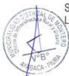
Cuadro N° 01

El proyecto se encuentra ubicado en el distrito de Montero y para acceder a este se hace a través de la Carretera Panamericana Norte a través de dos tramos: Tramo 1: Piura, Tambogrande, Las Lomas, Cruce Sajinos Paimas, Paimas, Puente Paraje, Montero. Tramo2: Piura, Sullana-Cruce Tambogrande, Las Lomas, Cruce Sajinos Paimas, Paimas, Puente Paraje, Montero.