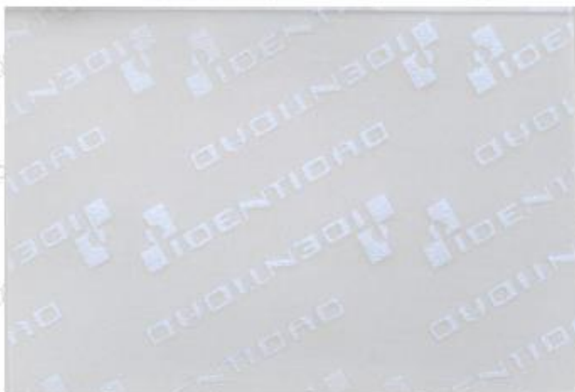
IMAGEN DE LA FILMINA DE SEGURIDAD