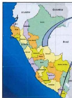
Figura 1: Mapa departamental del Perú

"MEJORAMIENTO DE VÍA A NIVEL DE AFIRMADO DE LA AV. NUEVA REQUENA (DESDE EL JR. PROGRESO HASTA LA AV. GASODUCTO) EN EL AA.HH. GUSTAVO MALDONADO ORNETA, DISTRITO DE YARINACocha CORONEL PORTILLO – UCAYALI", CUI N°2335512