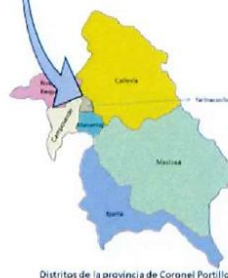
Figura 3: Mapa distrital de la provincia de Coronel Portillo