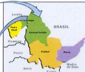
Figura 2: Mapa distrital del departamento de Ucayali