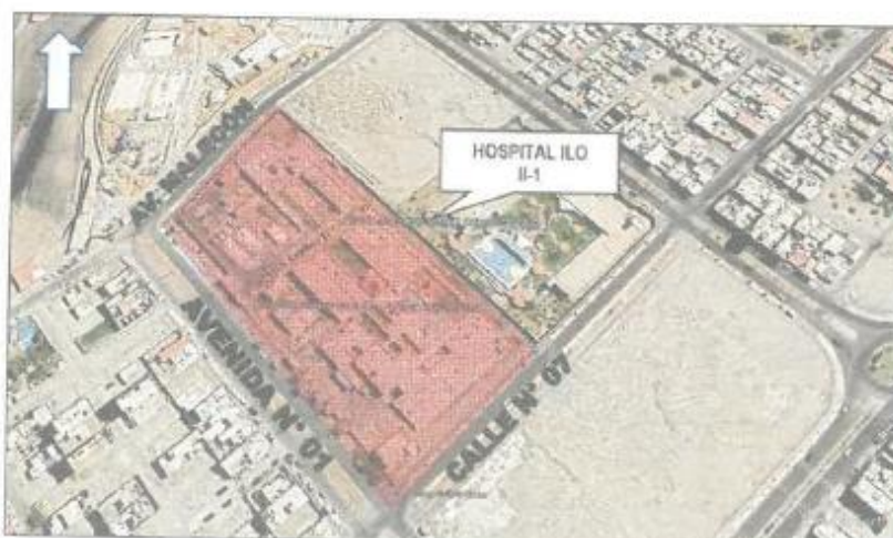
Vista en Google del Hospital Ilo II-1