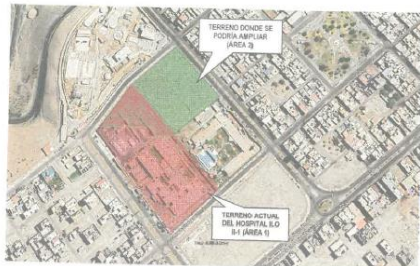
Vista en Google del Hospital Ilo II-1

El terreno donde se ubica actualmente el Hospital de Ilo (área 1) ha sido catalogado por los especialistas del PRONIS como un nivel de peligro por sismo Alto Mitigable, Se recomienda la Construcción del nuevo Hospital Ilo en un terreno sin riesgo.