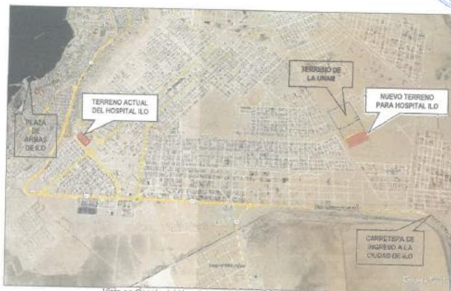
Vista en Google del Hospital Ilo II-1 en funcionamiento y del terreno propuesto para el estudio