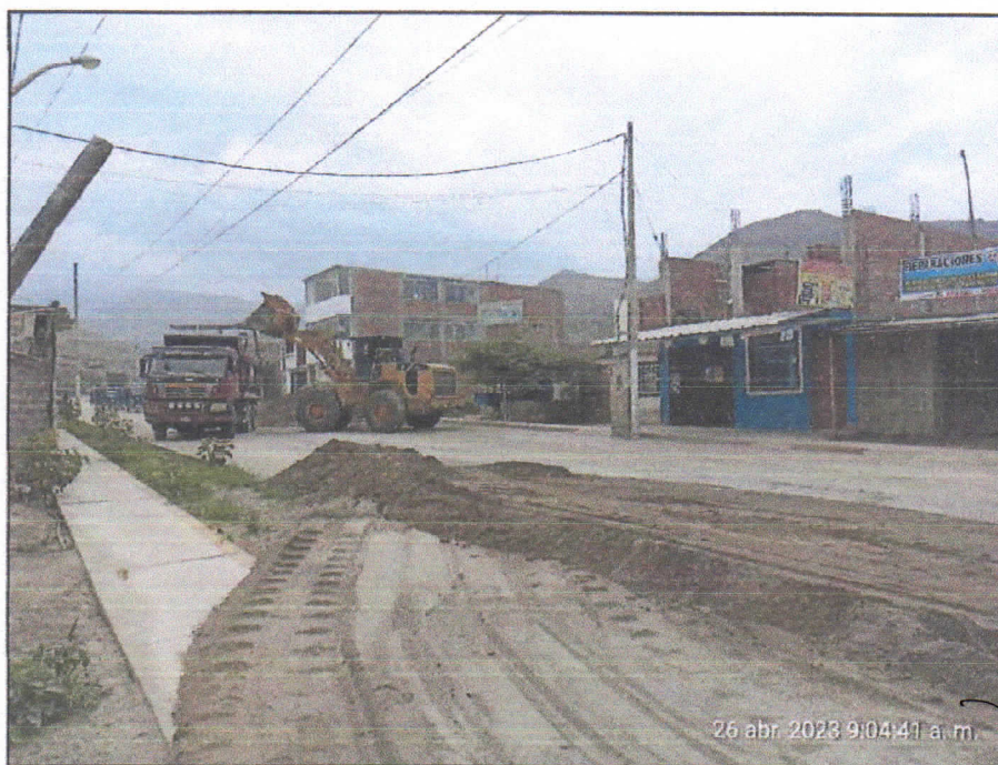
Foto N° 01: Vía departamental. Zona: Av. Prolongación Macash- Día: 26/04/2023.