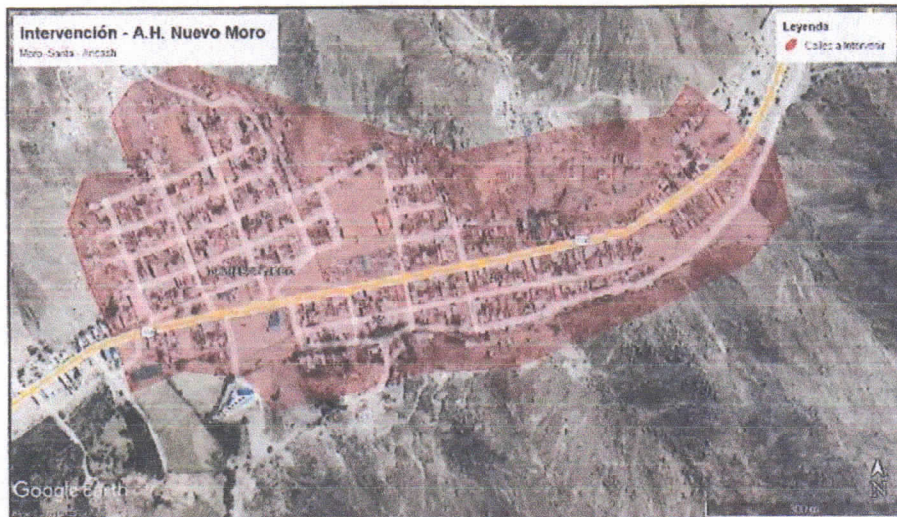
Imagen N° 02: Zona de Intervención (A.H. Nuevo Moro)