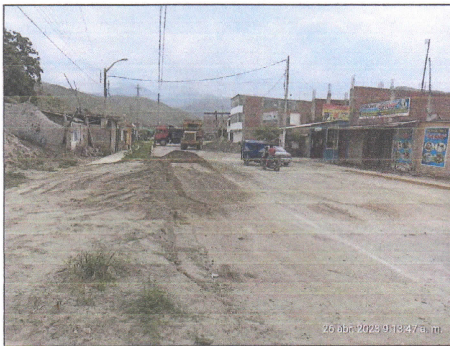
Foto N° 03: Vía departamental. Zona: Av. Prolongación Macash- Día: 26/04/2023.

Se realizará el relleno de los bordes de la vía con material afirmado o similar, hasta alcanzar el nivel de la calzada, con la finalidad de rehabilitar la vía en ambos sentidos, además se hará la limpieza y eliminación de lodo u otros residuos en la calzada, a fin de evitar la contaminación.