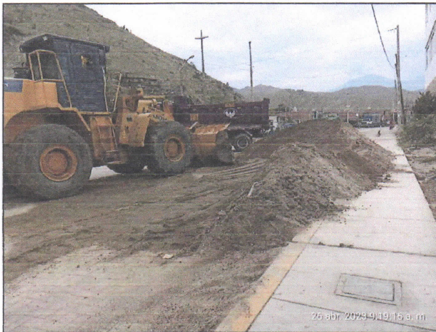
Foto N° 02: Vía departamental. Zona: Av. Prolongación Macash- Día: 26/04/2023.