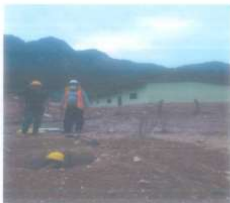
FOTO 1: Se muestra estructuras existentes