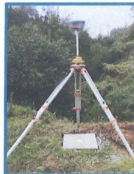
PUENTE EN ÑUÑUELO