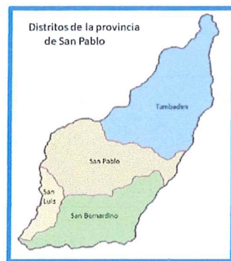
DISTRITO DE TUMBADEN