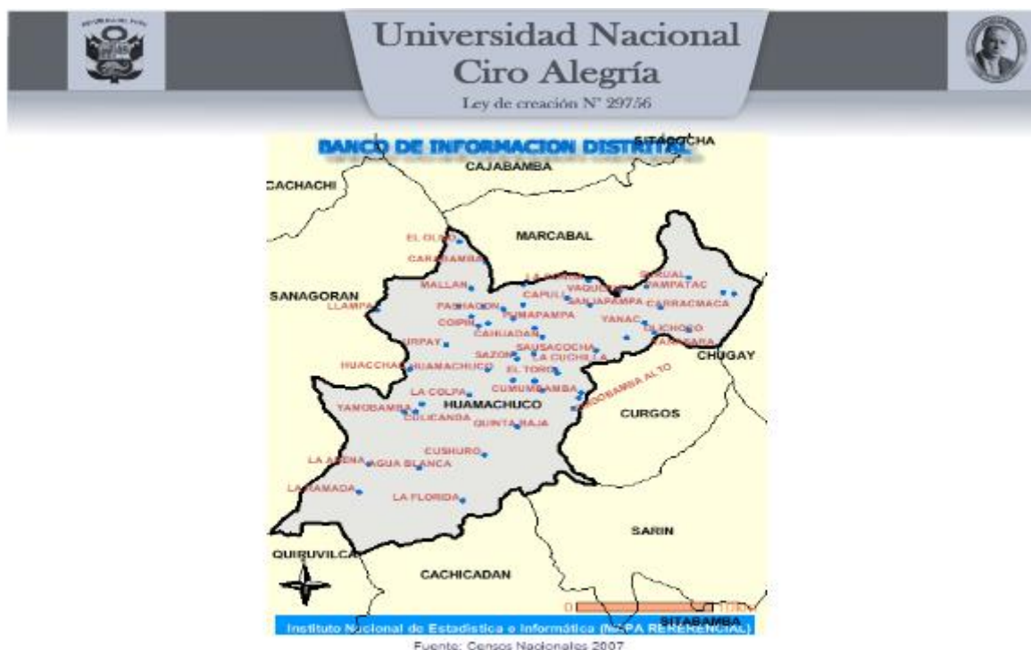
Imagen 02: Mapa Distrito Huamachuco