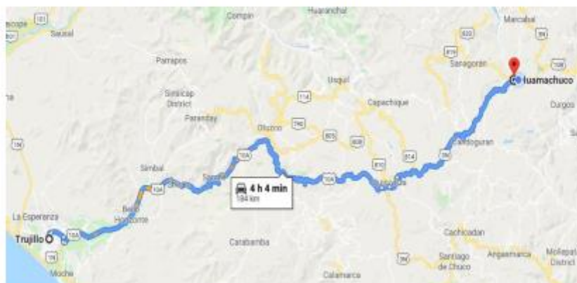
Imagen 03: Croquis de acceso Ciudad De Huamachuco

Tomando como referencia Ciudad de Trujillo – Huamachuco, se tiene: