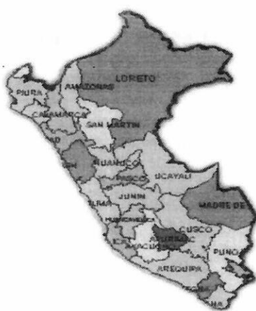
UBICACIÓN DE LA REGIÓN LORETO Y LA PROVINCIA DE LORETO EN EL PERÚ