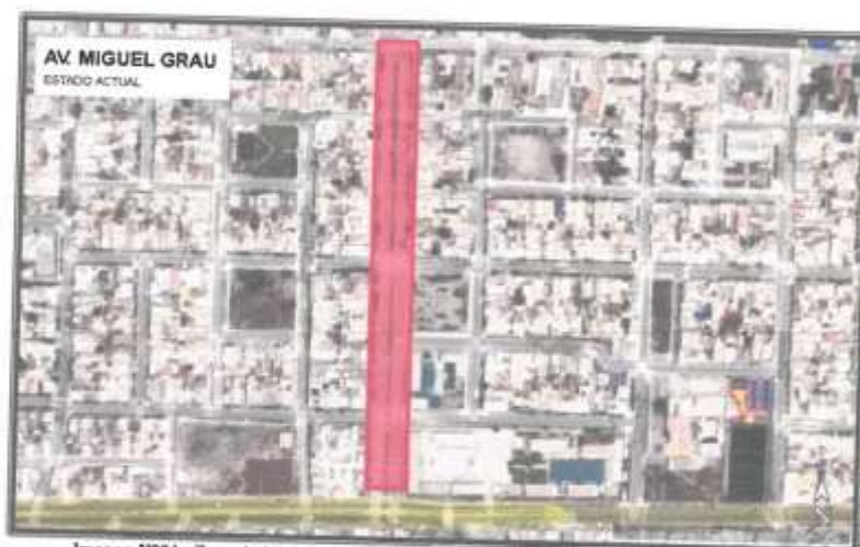
Imagen N°01.- Zona de Intervención. DESDE LA AV. CAMINO REAL hasta - AV. PERÚ. (dentro de la sección de color rojo)

COORDENADAS UTM - DATUM WGS 84 - ZONA 17L