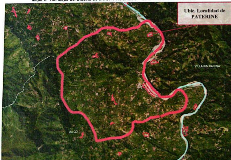
Mapa N° 1.2: Mapa del Distrito de UNION PROGRESO – LOCALIDAD DE PATERINE

Fuente: Geo invierte. Elaboración: Equipo de Trabajo.