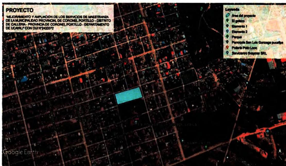
Imagen N°01: Ubicación del terreno en Google Earth.

AA.HH. : Asociación Civil Coronel Fav. Victor Manuel Maldonado Begazo. DISTRITO : Calleria. PROVINCIA : Coronel Portillo. DEPARTAMENTO : Ucayali.