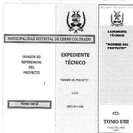
Figura 1. Forma de presentación del Expediente

Los expedientes deberán ser presentados en archivadores de palanca de lomo ancho. Cada archivador deberá considerar una carátula en la parte frontal y en lomo del mismo, para una rápida verificación. Se recomienda que dichas carátulas, deberán indicar como mínimo, lo indicado en la figura 1.