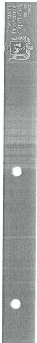
Cuadro N° 5.1