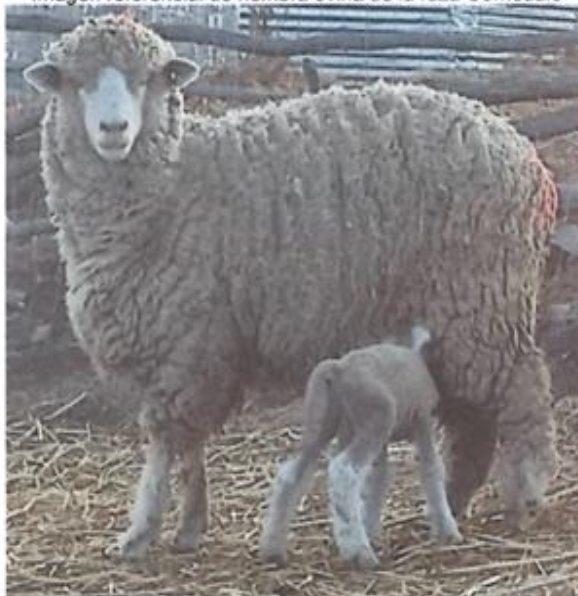
Imagen referencial de hembra ovina de la raza Corriedale