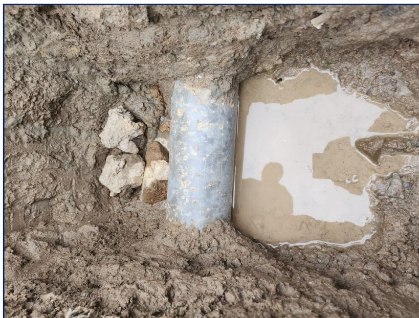
Imagen 1: Relleno inadecuado que afectara la funcionalidad y comportamiento de la tubería PVC.

Además, se evidenció la ausencia de una cama de arena u otro material adecuado que proporcione soporte uniforme a las tuberías a lo largo de su longitud, aumentando considerablemente el riesgo de deterioro y comprometiendo la durabilidad del sistema. Estas deficiencias resaltan la necesidad de implementar medidas correctivas que garanticen la instalación conforme a las especificaciones técnicas, asegurando un desempeño seguro y eficiente del sistema de agua potable.