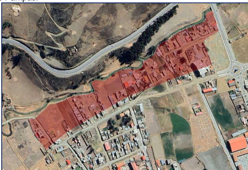
Imagen 2: Sectores que actualmente no cuenta con servicios de alcantarillado.

El nuevo diseño propone un replanteo para cumplir con los parámetros hidráulicos establecidos en las normas técnicas, asegurando que tanto la velocidad del flujo como la tensión tractiva media se mantengan dentro de los valores recomendados para un adecuado funcionamiento. Asimismo, se incluyó la profundización de los buzones, previendo futuras ampliaciones, y se verificaron las cotas de estos para que cumplan con el rango mínimo requerido por la normativa. El objetivo es conectar adecuadamente el sistema planteado con el barrio de Chalampampa y asegurar que las aguas residuales se transporten efectivamente hacia la planta de tratamiento de la ciudad de Pampas.