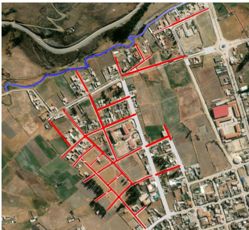
Vía de Intervención Redes de Alcantarillado