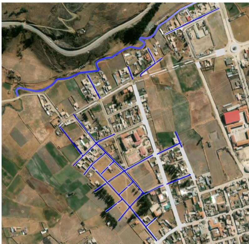
Vía de Intervención Redes de Agua