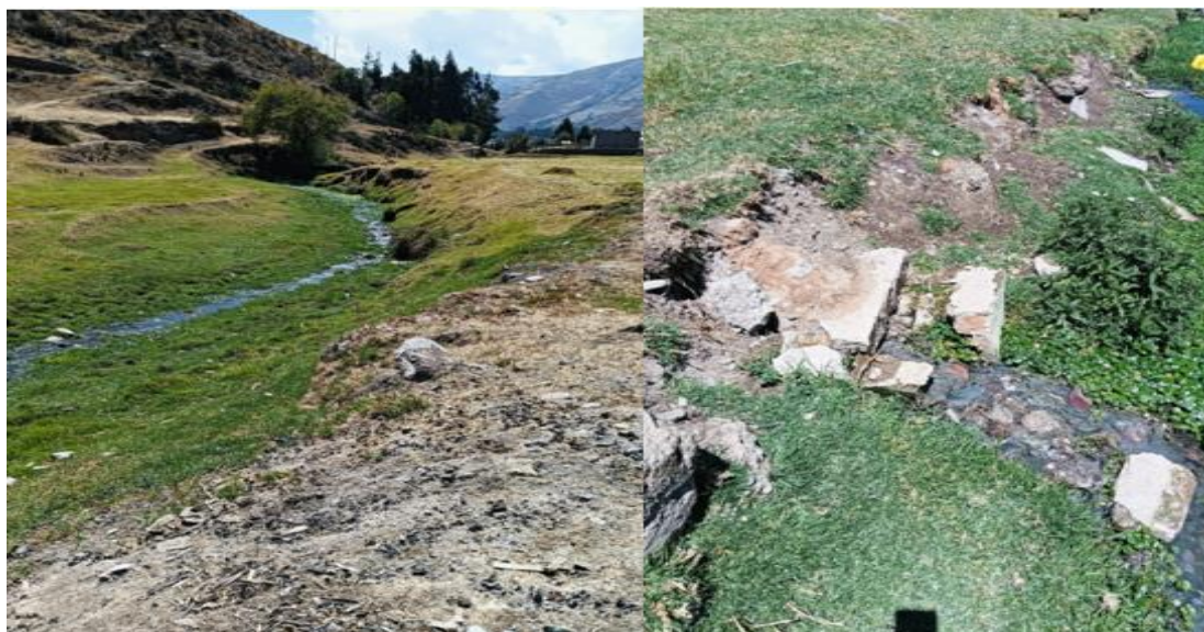
Imagen 3. Desemboque del alcantarillado clandestino al Rio Upamayo produciéndose contaminación