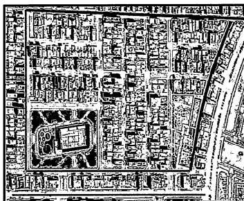
Imagen 01. Ubicación del servicio

DEPARTAMENTO : Ancash PROVINCIA : Santa DISTRITO : Nuevo Chimbote LOCALIDAD : H.U.P. Paseo del Mar Sector IV