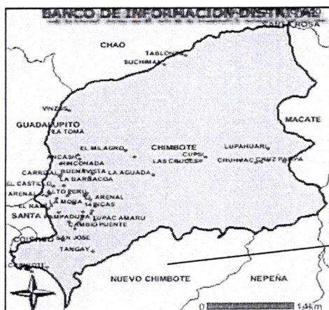
PROV. DEL SANTA