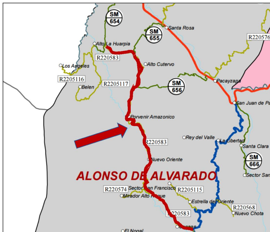
Fig. 01. EMP. SM-101 - CANAÁN - NUEVO ORIENTE - PORVENIR AMAZÓNICO - ALTO CUTERVO - EMP. SM-654.

Servicio de ejecución del mantenimiento rutinario del camino vecinal, Tramo: EMP. SM-101 - CANAÁN - NUEVO ORIENTE - PORVENIR AMAZÓNICO - ALTO CUTERVO - EMP. SM-654.