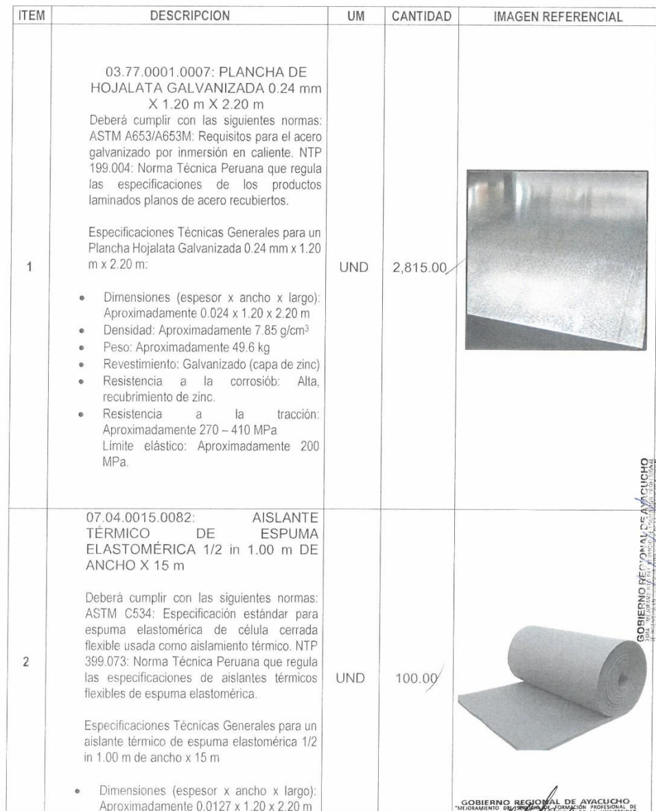
Tabla 1. Cantidad de los bienes a adquirir.