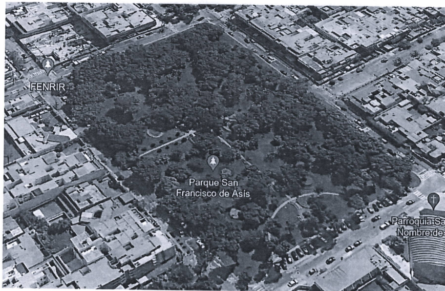
Figura 2: Ubicación del Parque San Francisco