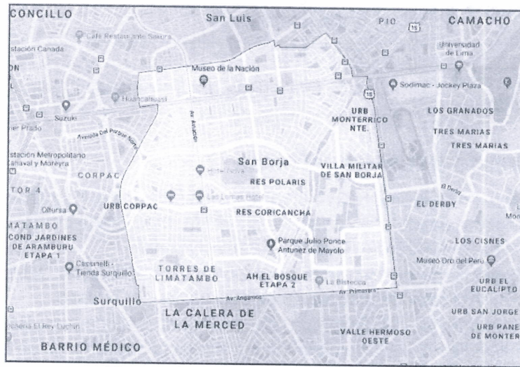
Figura 1: Ubicación del distrito de San Borja