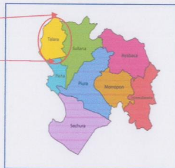
ILUSTRACIÓN 1: : MAPA DEPARTAMENTAL