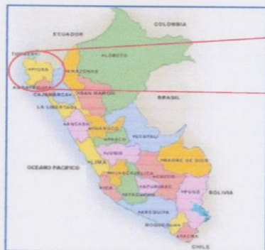
ILUSTRACIÓN 2: MAPA POLÍTICO DEL PERÚ