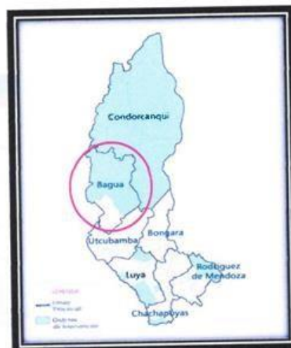
LOCALIZACIÓN GEOGRÁFICA DE LA PROVINCIA DE BAGUA