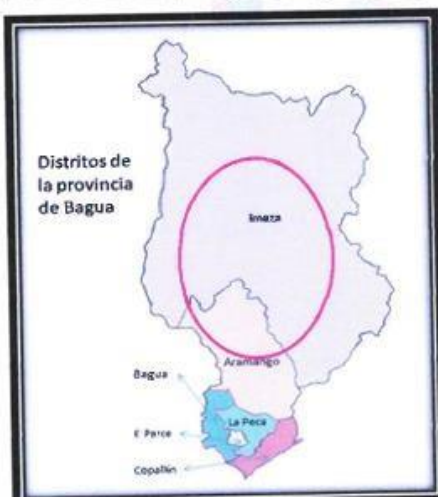
LOCALIZACIÓN GEOGRÁFICA DEL DISTRITO DE IMAZA