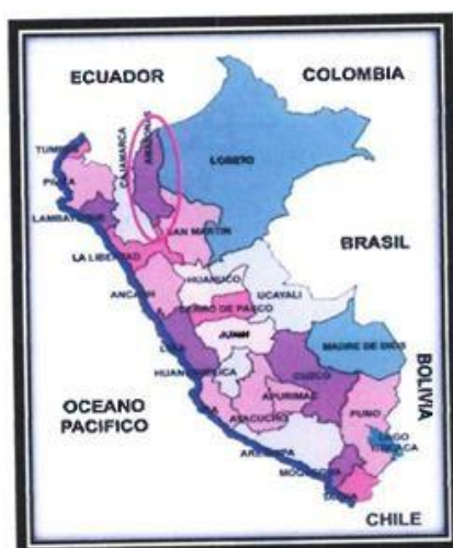
LOCALIZACIÓN GEOGRÁFICA DEL DEPARTAMENTO DE AMAZONAS