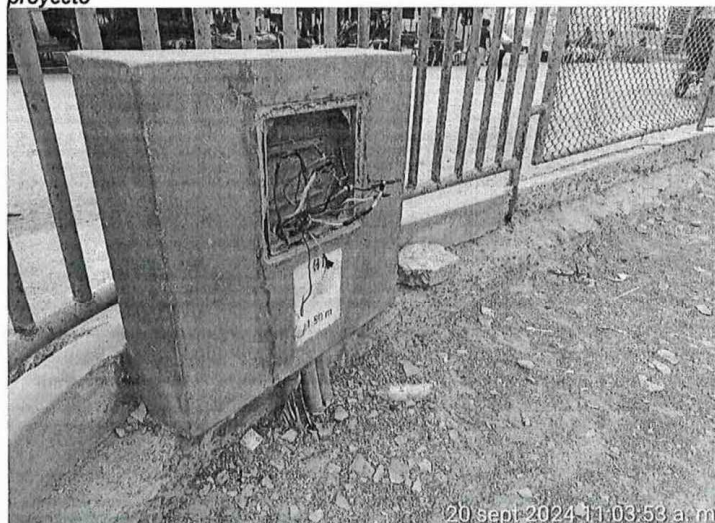
ILUSTRACIÓN N° 3. situación actual DE REFLECTORES DEL área del proyecto

Además, el sistema de red eléctrica no está funcionando correctamente, debido que los cables e interruptores del tablero general no están protegidos, estando expuestos a la intemperie y con el peligro de corte eléctrico y pudiendo causar accidentes en las personas que hacen uso del complejo deportivo.