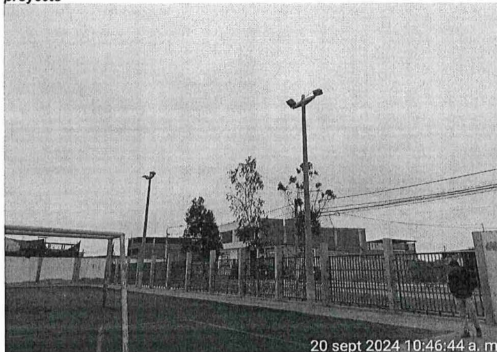
ILUSTRACIÓN N° 6. situación actual DE REFLECTORES del área del proyecto

La iluminación del complejo en los horarios nocturnos también es un problema debido a la falta de alumbrado de la cancha de fútbol debido a que los reflectores que rodean el campo no funcionan correctamente, haciendo difícil el desarrollo de las actividades deportivas, siendo una necesidad que se debe solucionar.