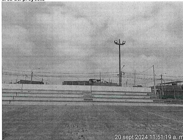
ILUSTRACIÓN N° 9. situación actual DE PINTURA EN GRADERIAS del área del proyecto