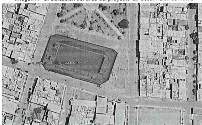
Imagen N° 5. Ubicación del área del proyecto CD Oscar Pelón Samamé