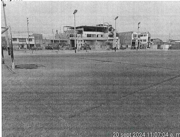
ILUSTRACIÓN N° 1. situación actual DE GRASS SINTETICO del área del proyecto

realizar prácticas deportivas, por el temor a lastimarse en dicha superficie, a esto le acompaña grandes marcas de grietas y deterioro de juntas.