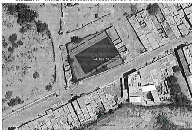
IMAGEN N° 4. ÁREA DE INFLUENCIA DEL PROYECTO CD FÉLIX POMACHARI