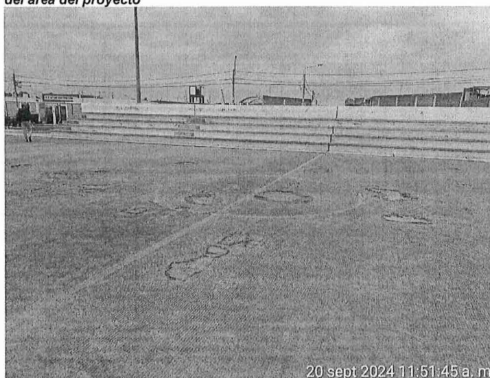
ILUSTRACIÓN N° 7. Vista de la situación actual DEL GRASS SINTETICO del área del proyecto

En la cancha de fútbol existen muchas áreas deterioradas, el grass sintético se ha removido quedando una superficie áspera y con pequeñas piedras que, al contacto con la piel, estas dejan grandes marcas entre los que usan este servicio, por ello pocas veces se presentan vecinos o de otros sectores a realizar prácticas deportivas, por el temor a lastimarse en dicha superficie, a esto le acompaña grandes marcas de grietas y deterioro de juntas.