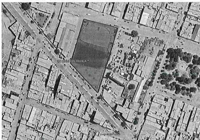
IMAGEN N° 3. ÁREA DE INFLUENCIA DEL PROYECTO CD CHUPÓN DÁVILA