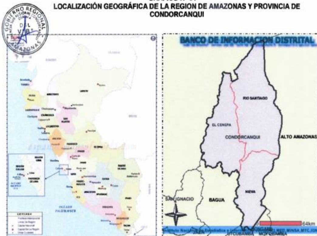
GRAFICO N° 02

LOCALIZACIÓN GEOGRÁFICA DE LA REGION DE AMAZONAS Y PROVINCIA DE CONDORCANQUI