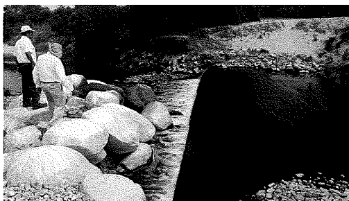
Figura 1: Exposición de la estructura de la alcantarilla 13.08 en la margen derecha del Río Piura.

En el año 2023 después del fenómeno Yaku se colocó roca al volteo en una longitud aproximada de 80 metros lineales, actualmente la erosión está afectando la orilla de la margen derecha, por lo que la estructura de la alcantarilla está desprotegida en aproximadamente 30 metros, tal como se muestra en la siguiente figura.