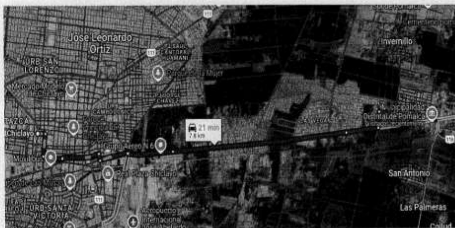
Imagen: Acceso a la zona de trabajo.